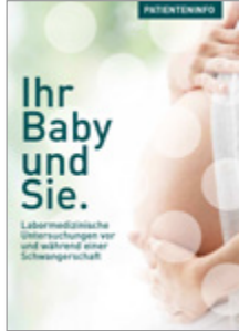
Ihr Baby und Sie.