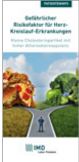
Gefährlicher Risikofaktor für Herz-Kreislauf-Erkrankungen