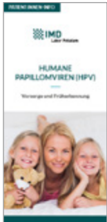
Humane Papillomviren (HPV)