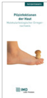
Pilzinfektionen der Haut