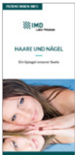
Haare und Nägel