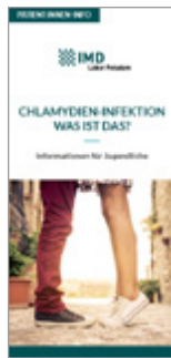
Chlamydieninfektionen Was ist das?