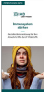
Immunsystem mit Vitalstoffen stärken