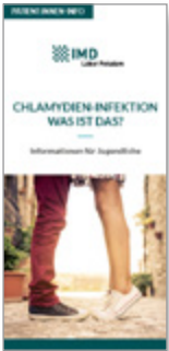
Chlamydieninfektionen Was ist das?