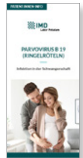
Parvovirus B 19 (Ringelröteln)