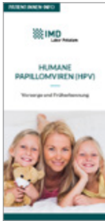
Humane Papillomviren (HPV)