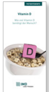
Vitamin D Wie viel Vitamin D benötigt der Mensch?