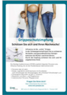
Gripeschutzimpfung Schützen Sie sich und Ihren Nachwuchs!