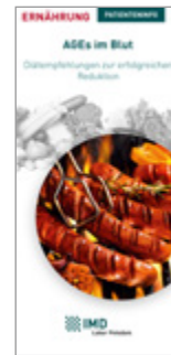
AGEs im Blut