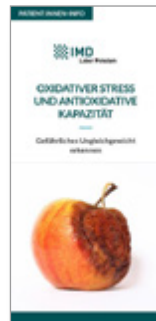
Oxidativer Stress- und antioxidative Kapazität