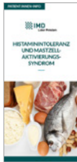
Histaminintoleranz und Mastzell- aktivierungssyndrom