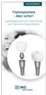
Titanimplantate - Aber sicher!