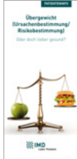
Übergewicht (Ursachenbestimmung/ Risikobestimmung)