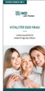
Vitalität der Frau