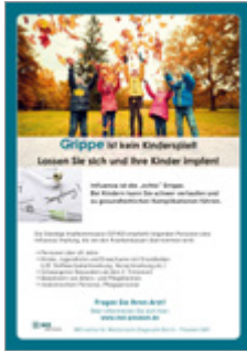
Grippe ist kein Kinderspiel!