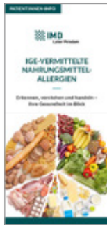
IgE-vermittelte Nahrungsmittel- allergien