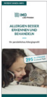
Allergien besser erkennen und behandeln