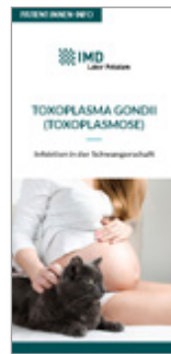
Toxoplasma Gondii (Toxoplasmose)