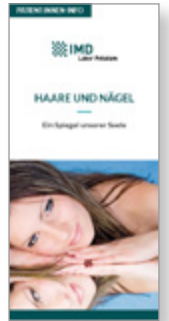
Haare und Nägel