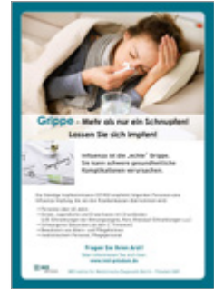
Grippe mehr als nur ein Schnupfen! Lassen Sie sich impfen!