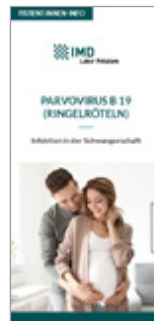
Parvovirus B 19 (Ringelröteln)