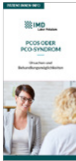
PCOS oder PCO-Syndrom