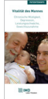
Vitalität des Mannes