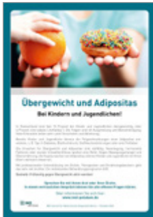
Übergewicht und Adipositas