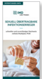
Sexuell übertragbare Infektionserreger