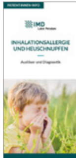
Inhalationsallergie und Heuschnupfen