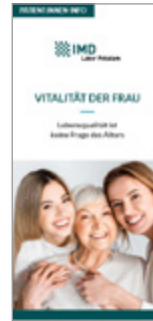
Vitalität der Frau