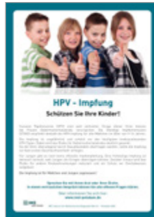
HPV-Impfung Schützen Sie Ihre Kinder!