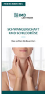
Schwangerschaft und Schilddrüse