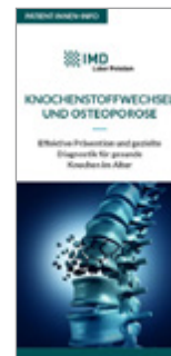
Knochenstoffwechsel und Osteoporose