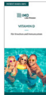
Vitamin D Für Knochen und Immunsystem