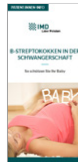
B-Streptokokken in der Schwangerschaft